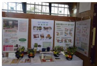
当法人事業所パネル展示