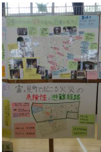
松浪中学校生徒作品